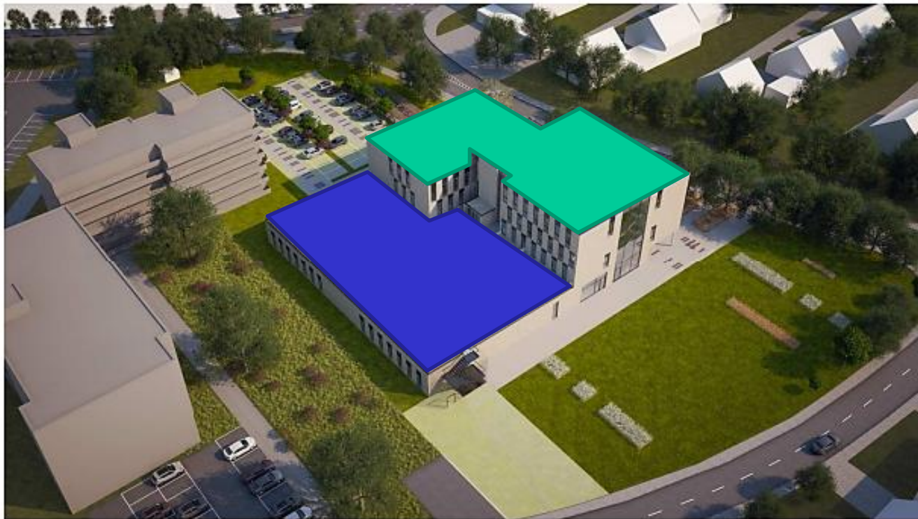
Vogelperspektive 1. BA