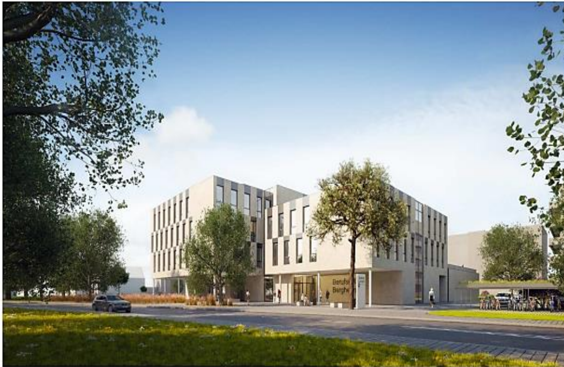
Neubau Berufskolleg Bergheim, Ansicht von der Straße Kentener Wiesen