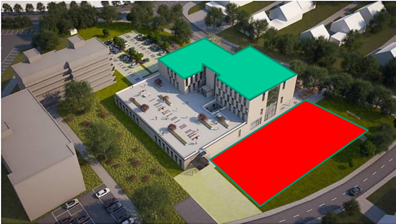
Vogelperspektive 1. BA