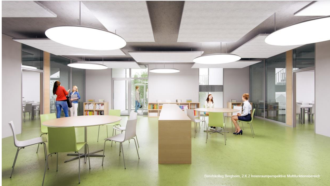
Multifunktionsfläche im 1. BA